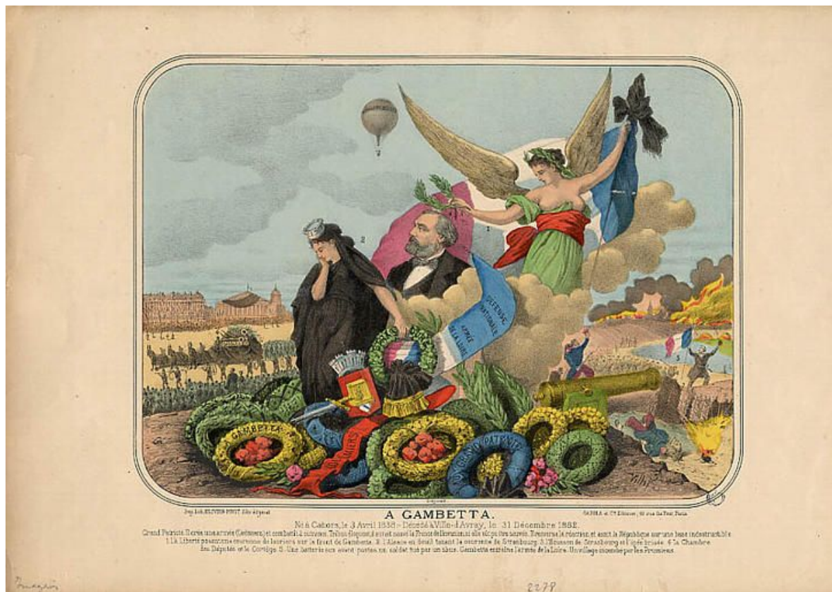
Document 4 : À Gambetta , Olivier Pinot, éd. Gadola & Cie, Épinal, après 1882 (musée des Civilisations de l'Europe et de la Méditerranée)

Pour citer : Edouard Galby-Marinetti, « La Figure volante de Léon gambetta, iconographie », Les Grandes figures historiques dans les Lettres et les Arts [En ligne], 02 | 2013, URL : http://figures-historiques.revue.univlille3.fr/n-2-2013/ .