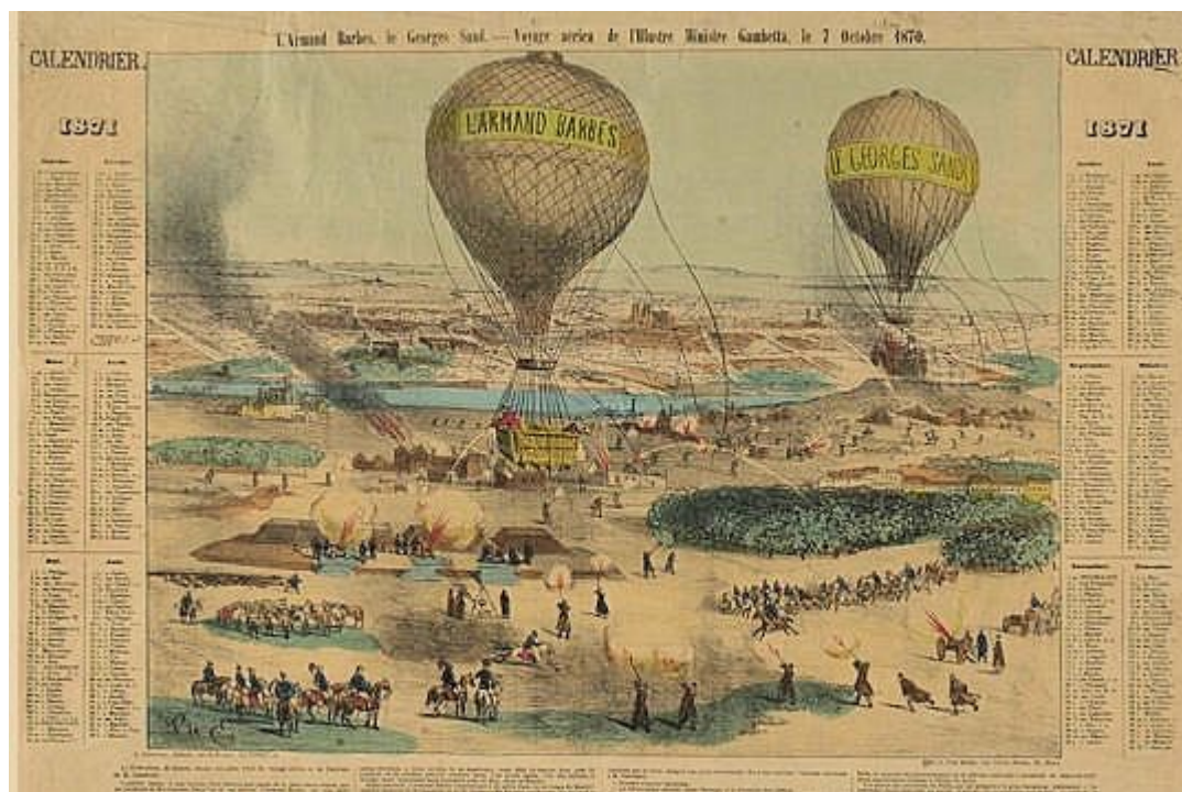
Document 3 : Calendrier de 1871, J. Van Heeke, lithographe, éd. J. Dosseray (musée des Civilisations de l'Europe et de la Méditerranée)

Pour citer : Edouard Galby-Marinetti, « La Figure volante de Léon gambetta, iconographie », Les Grandes figures historiques dans les Lettres et les Arts [En ligne], 02 | 2013, URL : http://figures-historiques.revue.univlille3.fr/n-2-2013/ .